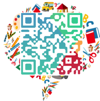
产业联盟 信息平台