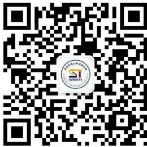
深圳产学研 创新联盟微信