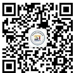
深圳产学研 创新联盟微信