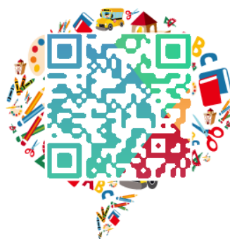
产业联盟 信息平台